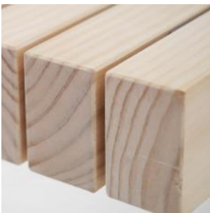
高耐久化天然木材「アコヤ」