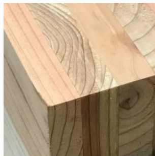
CLT( 直交集成板 )

Cross Laminated Timber ひき板を繊維方向が直交するように積層接着したパネル